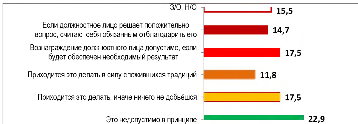
Рисунок 1 — Распределение ответов взрослых жителей Беларуси на вопрос: «Как Вы относитесь к неофициальному вознаграждению должностных лиц, которые в силу их служебного положения могут помочь Вам решить проблемы?», в %

Для того чтобы определить степень моральной готовности наших сограждан к «взяткодающей практике», мы задали соответствующий вопрос в анонимной социологической анкете. Зондажной шкалой стали различные модальности коррупционной готовности, начиная с минимальной («считаю это недопустимым в принципе») до максимальной («считаю себя обязанным отблагодарить госслужащего»). На рисунке 1 представлено распределение ответов респондентов на вопрос: «Как Вы относитесь к неофициальному вознаграждению должностных лиц, которые в силу их служебного положения могут помочь Вам решить проблемы?».